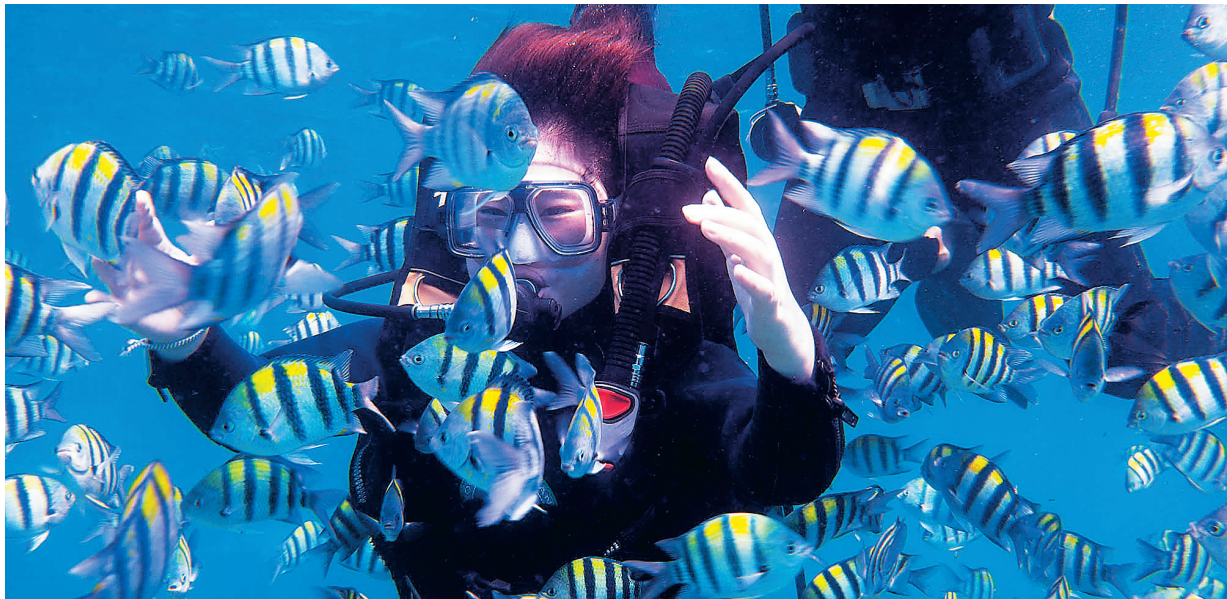
游客在分界洲岛体验潜水。

“旅游是一种异地体验,民族的才是世界的。”国家开放大学(海南)国际旅游学院执行院长杨哲昆长期关注海南旅游业。他认为,陵水虽拥有富足的潜水资源,但对资源的开发处于简单模仿阶段,缺乏本地特色,运营水平仍较为低下。“最迫切的是打造陵水独特的‘海的味道’。”杨哲昆建议陵水围绕潜水产业布局旅游新篇章,按照产业化格局进行精细、系统的开发,并形成产品