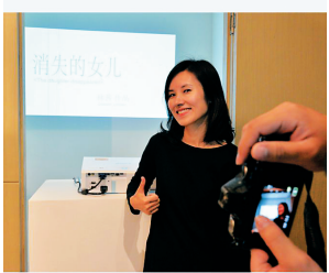
《消散的女儿》影像作品。作者:云胜林茜