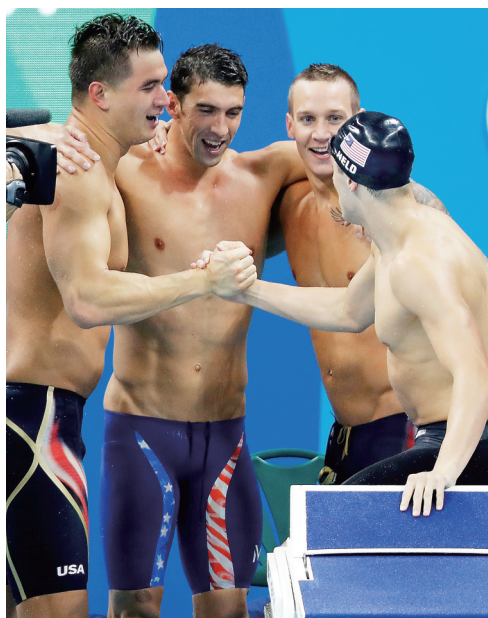
美国队选手阿德里安·菲尔普斯、弗雷塞与瑞恩(从左至右)庆祝4×100米自由泳接力夺冠。