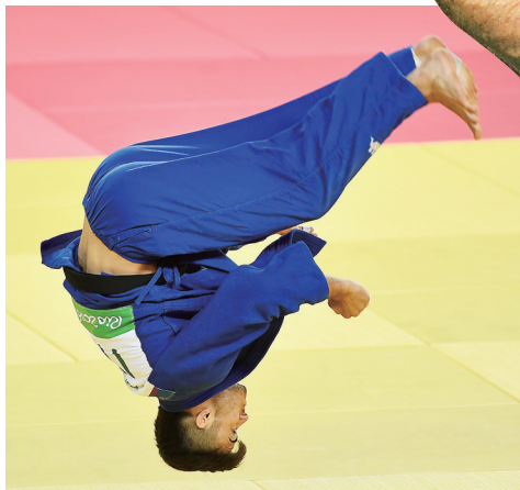
意大利柔道选手巴西莱空翻庆祝夺冠。