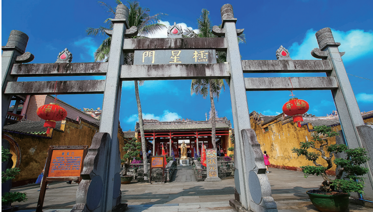
文昌孔庙。

潘存所生活的年代,中国处于三千年未遇之大变局,他矢志创办书院,并以自己的德操影响一方。他不仅是著名书法家、诗人,他更是一名热心文明革新、主张开放的官员,是海南建省最早的提出者。他一心一意致力于“教育兴国”“教育兴琼”,在教学中“崇实学,黜浮伪”,为海南培养了大批人才,对海南教育事业做出杰出贡献。由于潘存的影响力,直至宣统三年,不少学者曾在溪北书院讲学,一时人文兴旺,人才辈出,文化教育百年之功终于在民国结出硕果,文昌作为南方的文化重镇影响日大,抗战前广东省教育厅统计数据示:文昌县中小学数量之多,居全广东省第二,仅次于教育发达的梅县。而文昌的各科人才,急速增长,令世人瞩目。在接下来的下南洋、走西洋的近代风潮中,文昌人更是披荆斩棘,开一代风气之先,形成一座难以逾越的文化高峰。