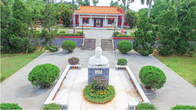
宋氏故居。