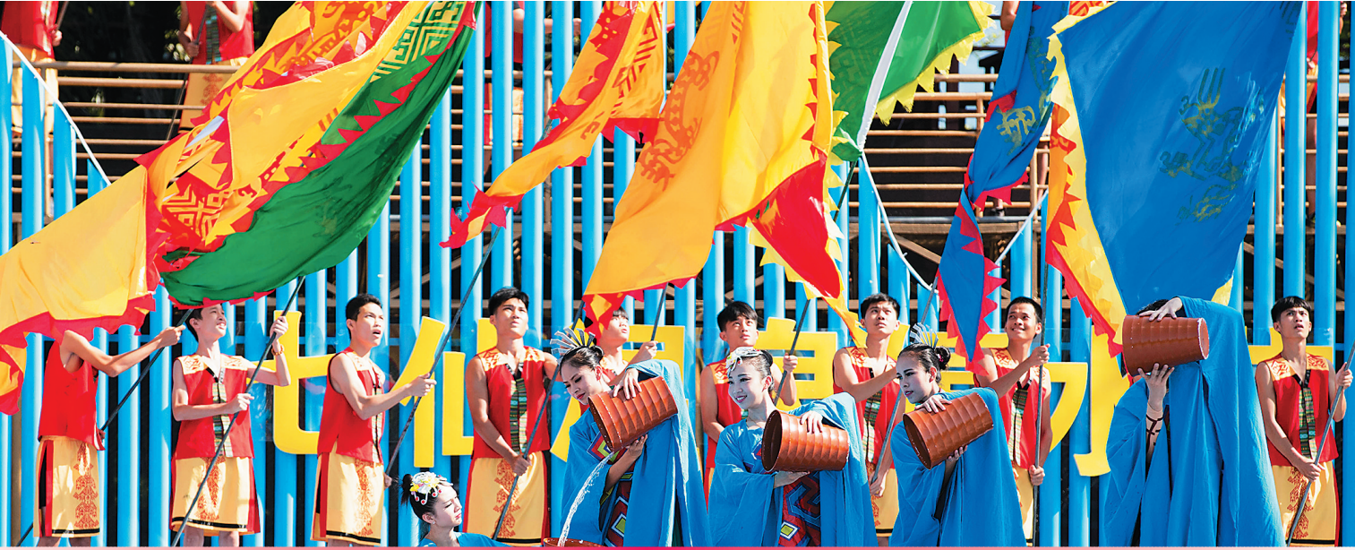
2016年海南七仙温泉嬉水节开幕。

七仙岭在远方注视,七仙河在身边流淌,十六年来,山河无言,静看保亭县城的浪漫民族之花,从一个苞骨朵到如今的热烈绽放。 说起保亭,大多数人脑海中会第一时间匹配出“嬉水节”这个关键词,联想到的是水花四溅、欢歌笑语,黎风苗韵的热烈气氛。 已经连续举办16年的海南七仙温泉嬉水节,将七夕有情人的欢乐,扩大到了全民共享的狂欢盛会。嬉水节,不仅是保亭黎族苗族人民的传统节日,还是保亭旅游资源、黎苗文化、经济发展的展示台和助推器,是保亭乃至海南最亮丽的一张文化名片。根据当地旅游部门不完全统计,今年嬉水节举办期间,保亭全县共接待了游客11.41万人次,同比增长21.52%。