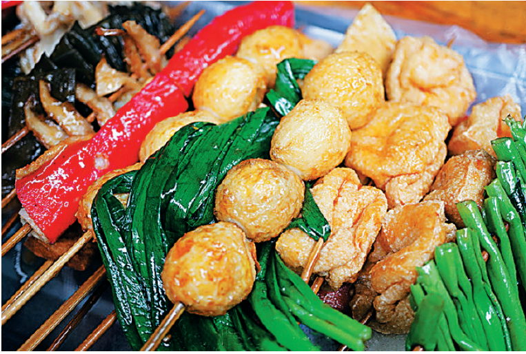
诱人的炸炸。

色。而有的食店，之所以令人铭记，则也是取胜于酱料。 芝麻、香料、胡椒粉、椒盐、孜然等多种佐料，按照独家的配方加入到耗油中，再用番茄酱中和一味的咸味，酸甜中带咸。独门的辣椒，也剁碎，加入热油，让油气和辣味都不至于太过。涂抹上这样的酱料，炸串才仿若有了灵动的生命。 一般的炸炸人们都喜吃咸味，蘸着酱料，和着热气，放进嘴里，表皮有些许脆，内里是食物的原味，吃出混合的美味。 还有的串串，人们更青睐于甜味。冬瓜薏，这一海南人钟爱的小吃，主料是地瓜粉，过油炸熟外层起一层焦皮，再淋上香甜浓郁的炼奶，一口咬下，弹力十足而又奶香四溢，谁又能忍住不点个赞！