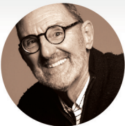
汤姆·梅恩 Thom Mayne