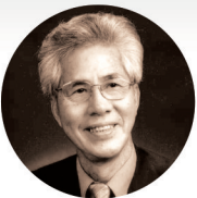
何镜堂 He Jingtang