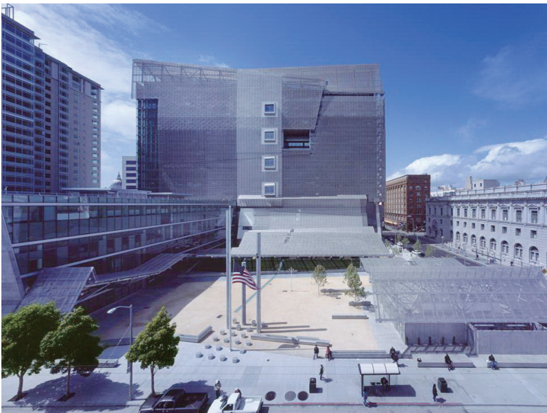
旧金山联邦政府大楼