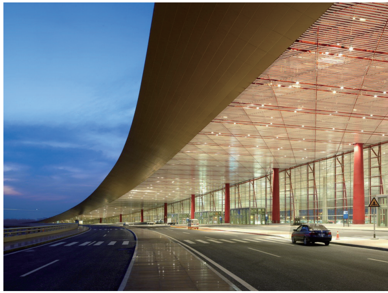
北京首都机场T3航站楼