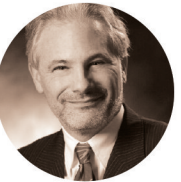
艾伦·贝斯基 Aaron Betsky