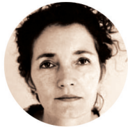
卡罗琳·博斯 Caroline Bos