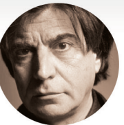
卡洛斯·法雷塔 Carlos Ferrater