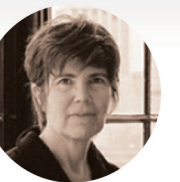
伊丽莎白·迪勒 Elizabeth Diller