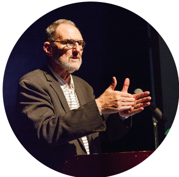
普利兹克奖得主、美国Morphosis Architects创始人 汤姆·梅恩(Thom Mayne)