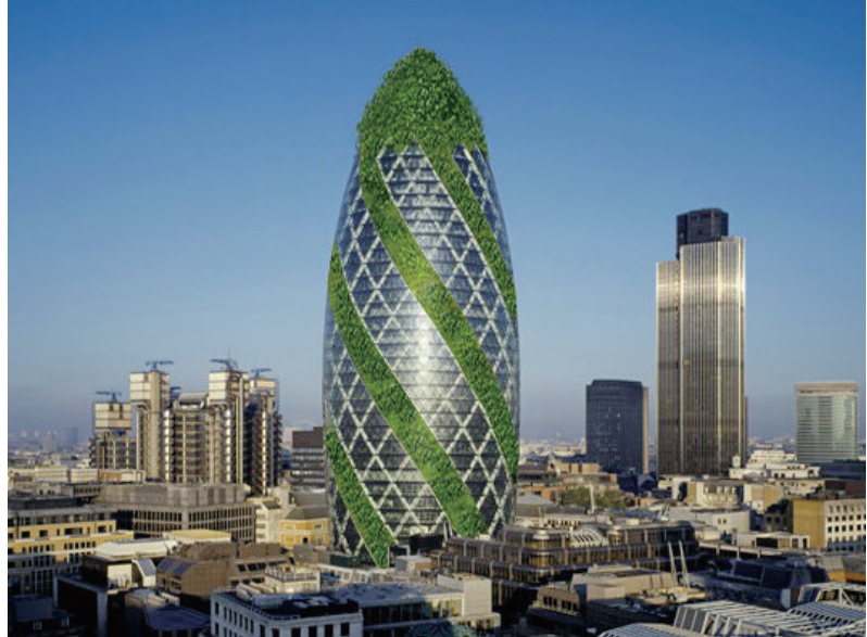
瑞士再保险公司总部大楼

此次演讲嘉宾汤姆·梅恩是2005年普利兹克建筑奖和2013年美国建筑师协会金质奖章得主,在国际上享有极高声誉。他于1972年在洛杉矶创建摩弗西斯建筑师事务所(Morphosis Architects),始终致力于多领域创意性建筑与城市设计、研究与实验工作,旨在通过动感的、演进式的实践,回应不断变化的现代生活的社会、文化、政治与技术等方面。他也是少数在早期采用电脑来分析基地、建构物体以验证自己理念的建筑师。其作品从单体住宅到市政建筑,再到城市规划都体现出特有的视觉张力,著名作品包括旧金山联邦政府大楼、爱默生学院等。