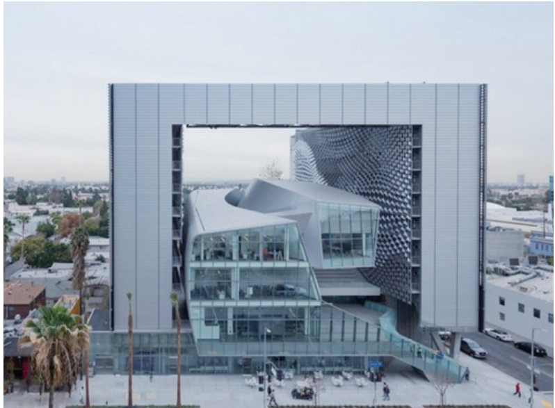
爱默生学院