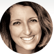
贝娜德塔·塔格利亚布 Benedetta Tagliabue