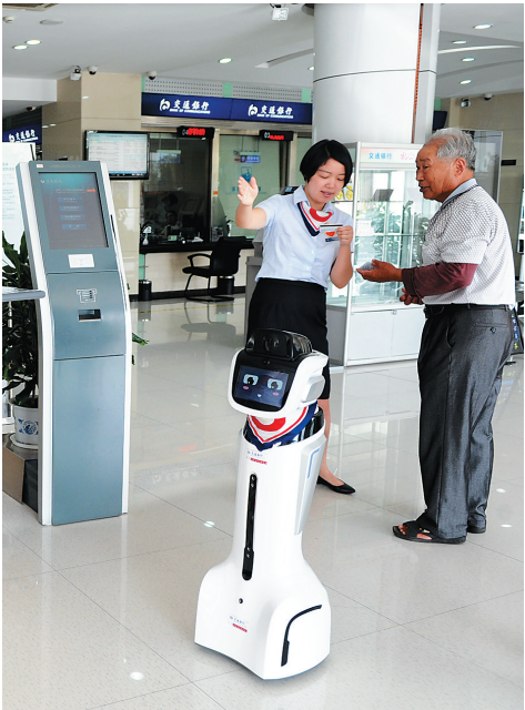
智能机器人“大堂经理”上岗

陆慷说,众所周知,联合国是由主权国家组成的政府间国际组织,只有主权国家才能申请加入。世界上只有一个中国,台湾是中国的一部分。中国政府和人民坚决反对任何形式的“台独”言行。任何挑战一个中国原则、制造“两个中国”“一中一台”的图谋都不可能得逞。