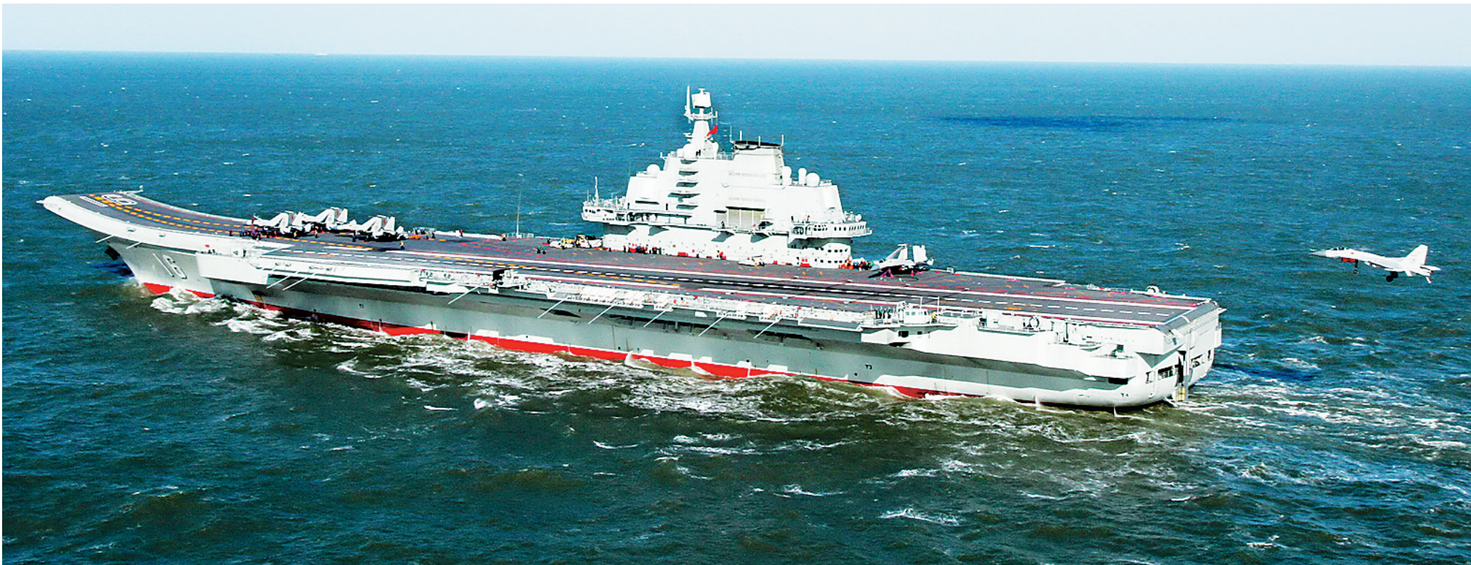
歼-15舰载战斗机准备着舰(资料照片)。