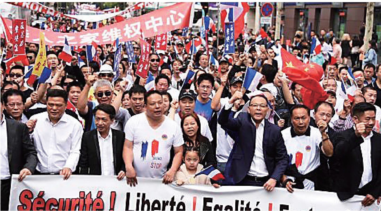
法国华人华侨举行“反暴力! 要安全!”大游行。