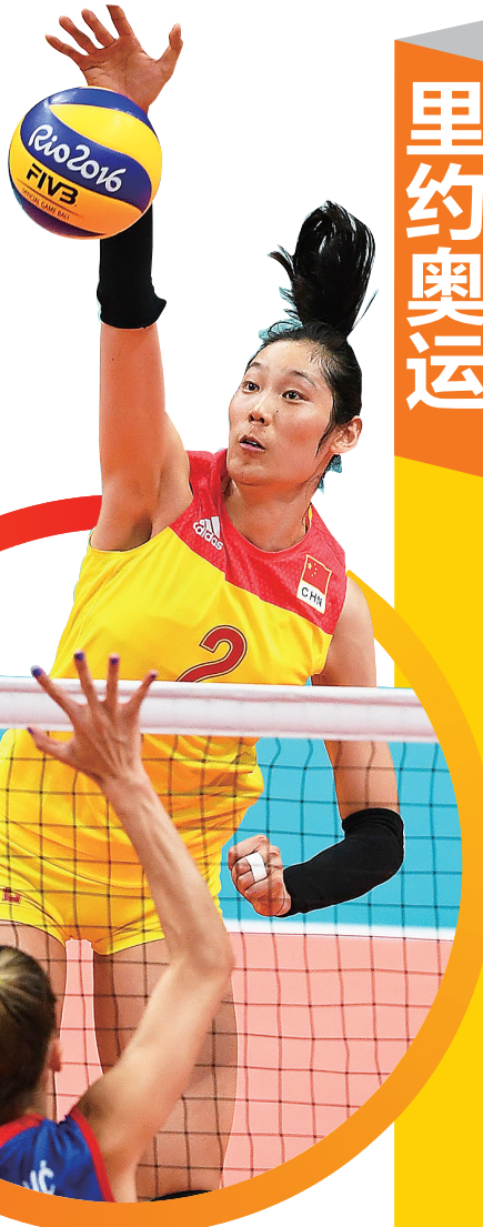
女排最有价值球员朱婷。

面对外界质疑和蓄意攻击，孙杨用“所有参加奥运会的运动员都应该被尊重”大气回应；面对首日遗憾，孙杨用实力和拼搏突破自我，首次夺得奥运会200米自由泳金牌；面对身体不适，孙杨带病出战，坚持