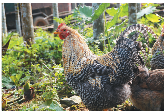
琼中芦花鸡。