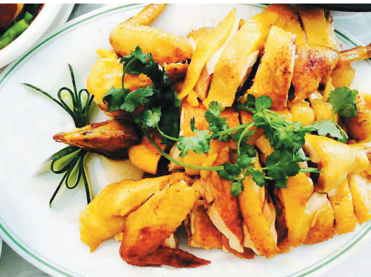
筵席上的琼中山鸡。