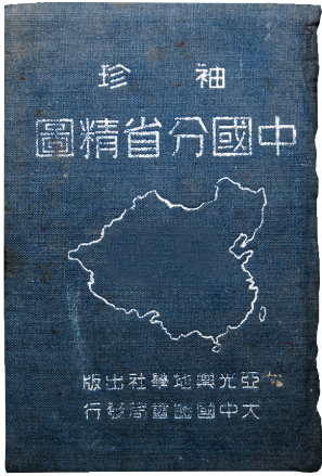
中华民国三十八年四月出版的《袖珍中国分省精图》。