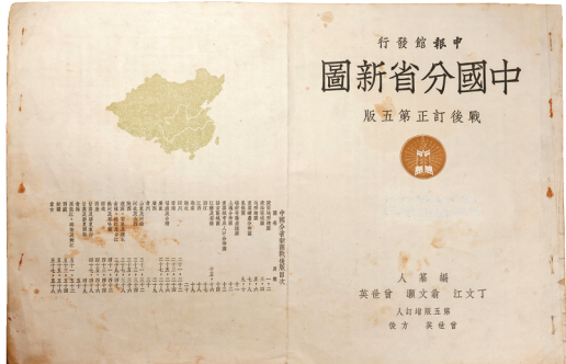
中华民国三十七年七月一日出版的《中国分省新图》的封面。