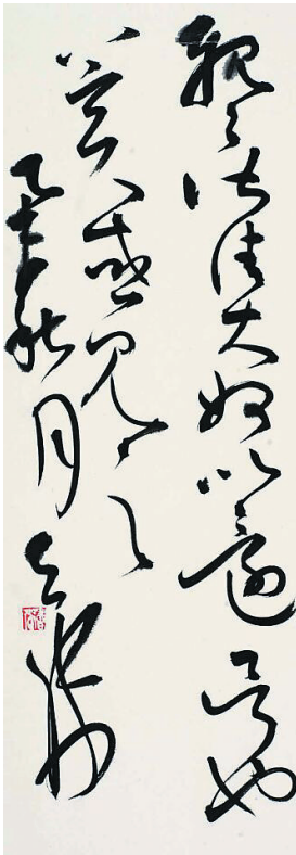
林书杰的草书作品。