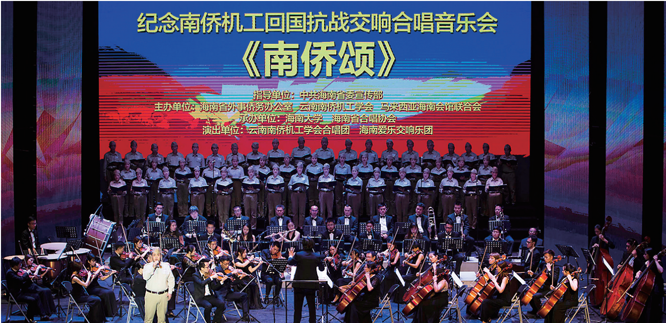
《南侨颂》演出现场。