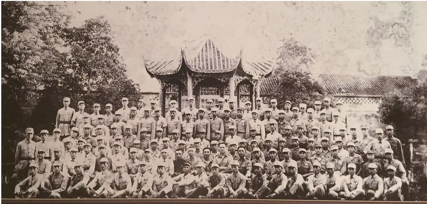
1945年，第54军军官庆祝抗战胜利合影。

在中国远征军的作战历史中，高黎贡山血战是绕不开的残酷一战。沧海桑田七十余载，人们不应忘记一位从海南文昌走出去的将领，他就是叶佩高，他也是中国远征军历史上第一位渡过怒江的中国将军，曾率军参与淞沪大战、武汉会战、滇西高黎贡山血战、腾冲城血战。 滇西反攻战的4个多月里，叶佩高屡立战功，后不仅荣升为54军副军长，还深受史迪威将军赞赏，获颁美国总统杜鲁门勋章。立下赫赫战功的叶佩高，1922年远离故乡北上，参加抗战后，仅回过两次海南，一次是娶原配过门，一次是作为战胜方代表回家乡接受海南岛的日本军投降。