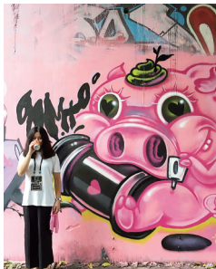
“馒头”和她的涂鸦作品。