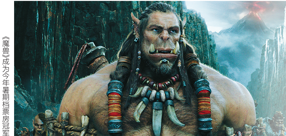
《魔兽》成为今年暑期档票房冠军

海南院线业内人士告诉记者，按理说，今年暑期档应该比去年同期票房出现增长，一是因为国产片保护月基本不再强调，二是新增加了不少影