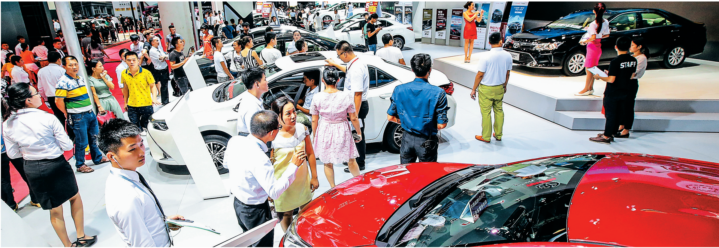
众多汽车品牌同台展出。