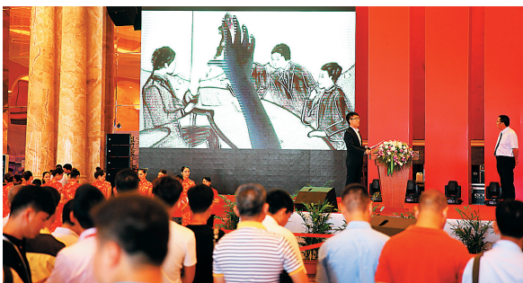
车展为市民准备了丰富多彩的活动，图为沙画表演。