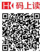
视频剪辑：王诗童 视频拍摄：张茂 李幸璜 扫码看2016金秋车展

本报海口9月8日讯（记者周晓梦）天鹅湾·海报集团2016金秋车展今天鸣锣开展，车展现场人气颇旺，除了众多汽车品牌同台展出、新车登台发布之外，记者在现场采访看到各参展车商为争夺人气销量，纷纷推出众多优惠。对消费者而言，这无疑入手新车的最佳时机。