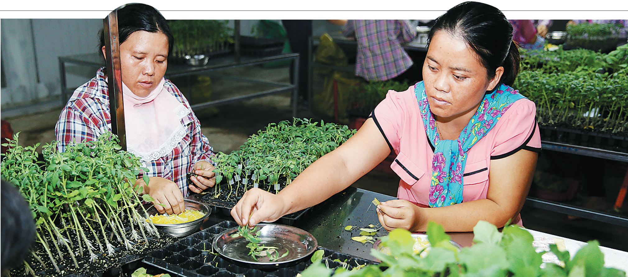
昌江农贸蔬菜集约化育苗中心投产

据了解，秀英区2016年有省重点项目32个，市重点项目8个，目前秀英区省市重点项目开工已达18个，占该区项目总数的一半以上。