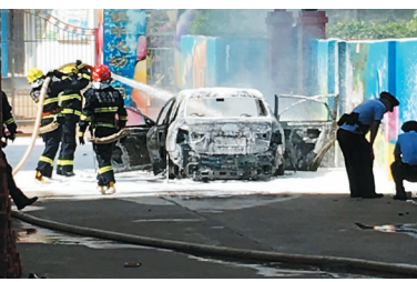
大火已经被消防官兵扑灭。