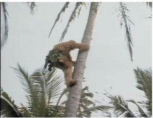
《西游记》中猴王爬上椰树的镜头。