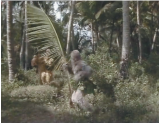
《西游记》中猴王出世后觅食的镜头在文昌取景。

西行此去30年，央视拍摄的86版西游记早已经成为经典，不知多年以后是否还有人记得，西行而去的师徒四人，还曾在海南的土地上行走过？