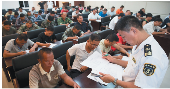
参加培训的学员在参加理论知识考试。

培训结束后,学员们要经过海事机构考核认证,并获取冲锋舟驾驶相关合格证书,持证上岗,充当全省抗洪抢险救灾主力军。图