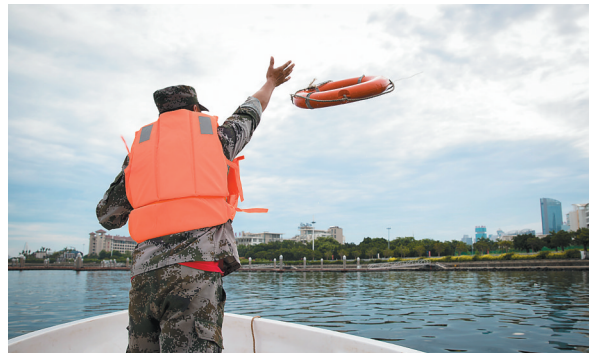
参加冲锋舟驾驶员培训的学员在模拟向落水人员抛救生圈。