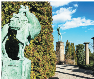
花园的第二级平台。