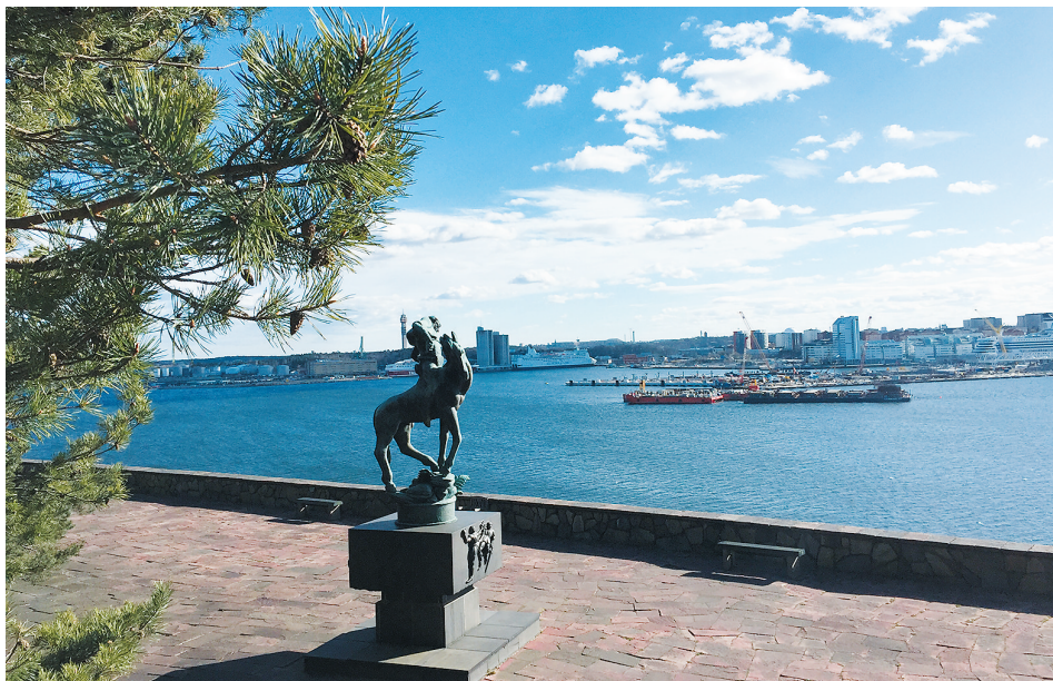
米勒斯花园朝着利拉瓦塔海湾的一面。

紧邻悬崖,最开阔的第一级阶梯平台上,数米之高的大型雕塑“海神波塞冬”“人与飞马”,群雕“天使音乐家”相邻而立。体态健硕高大,有着仿佛远古人类的脸的海神波塞冬,正面望着利拉瓦塔海湾;波塞冬左侧,几与蓝天相接的人踏在飞马之上,仿佛随时凌云归去。右侧是轻灵的天使