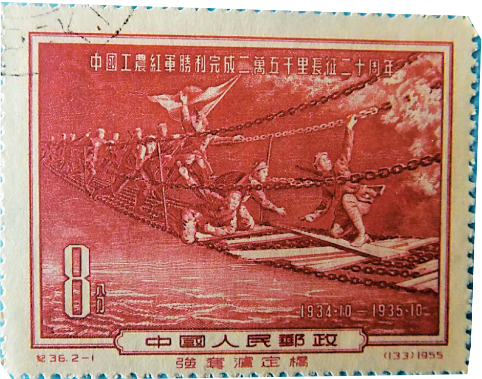
1955年发行的长征纪念邮票《强夺泸定桥》。