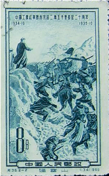
1955年发行的长征纪念邮票《过雪山》。