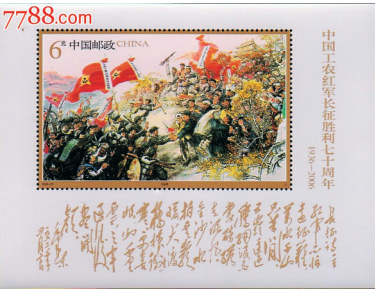
2006年发行的小型张《大会师》。

80年转瞬即逝,但红军足迹和长征精神没有消失,不同的人正在以不同的方式缅怀这段难忘的岁月。收藏圈悄然兴起了“长征”热,“长征”正在方寸之间传承着它的精神和价值。■