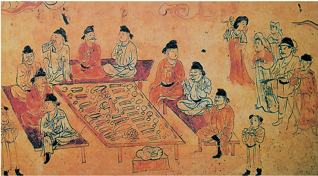
唐代鹿鸣宴图(局部)。

又是一年一度的大学新生入学季,时间来到9月中旬,报名大潮也逐渐接近了尾声。进入大学前,经济条件允许的学生、家长少不了要宴请亲朋好友,分享喜悦,免不了会有“升学宴”。 如果说时下的“升学宴”往往流于世俗,那么,古代中国的此类宴会则多了几分风雅,显得比较高大上。