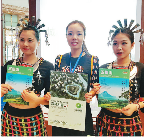
黎族阿妹在推介五指山旅游。

“时间安排得太紧了，你们应该多待几天。”9月14日晚，2016年海南五指山市（成都）城市形象暨旅游房地产展示会即将闭幕，就在大部分房地产商准备撤展时，不少成都市民感慨道。 据展会组委会统计，成都站参展企业接待了数千名观展的成都市民，展会现场部分市民表示，想去五指山亲自看一下，买得心里踏实。在现场的观展市民刘先生表示，“五指山生态环境没得说，但是我们去看的就是周边的配套设施和环境，这样爸妈住在那里我们才放心。” 展会现场的黎族歌舞让成都市民纷纷驻足观看，身着黎族桶裙的黎族姑娘以热情好客换得了成都市民的点赞。“不为买房子我也要去五指山看看，走走黎族的村落和景点，感受一下翡翠山城。” 值得一提的是，除了此次旅游地产、旅游产品、黎苗文化的展示，五指山市旅游商务局也带去了五指山市2016年重点招商项目，例如牙胡梯田招商项目、五指山国际自行车绿道招商项目和五指山市文体娱乐中心招商项目等，希望引来更多的投资者一起建设美丽的五指山。