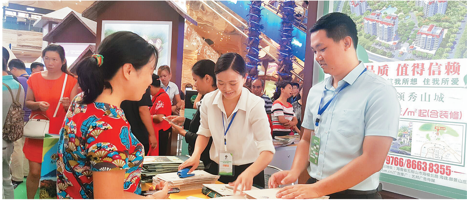
成都市民咨询五指山楼盘信息。

五指山地处北纬18度，是有名的“翡翠山城”。五指山拥有约147万亩的森林植被，植被覆盖率达到了86.44%，空气中负氧离子含量最高时可达150000个/每平方厘米，日均气温约为22摄氏度……五指山市以优越的生态环境赢得了北京、成都两地市民的青睐。 五指山市作为海南中部山区的一座小城，随着国际旅游岛建设的不断深入推进，逐渐创出了名气，成为“候鸟”人群选择度假、定居的重要目的地。 今年以来，海南房地产市场进入深度调整期，国家及省委省政府利好政策正在进一步实施，市场需求明显释放，全省房屋销售持续升温。受经济大环境影响，五指山市房地产开发投资继续保持增长，商品房销售面积仍在增长，全市房地产市场保持健康发展。但当前五指山市房地产去库存仍然有一定压力，需要新的工作思路和有力措施，以保证全市房地产市场持续健康发展。 “酒香还怕巷子深”。五指山的旅游、房地产的外向型结构决定必须要走出去才能有发展，才能赢得市场。五指山市住房保障和房产管理局相关负责人透露，五指山市绝大部分商品