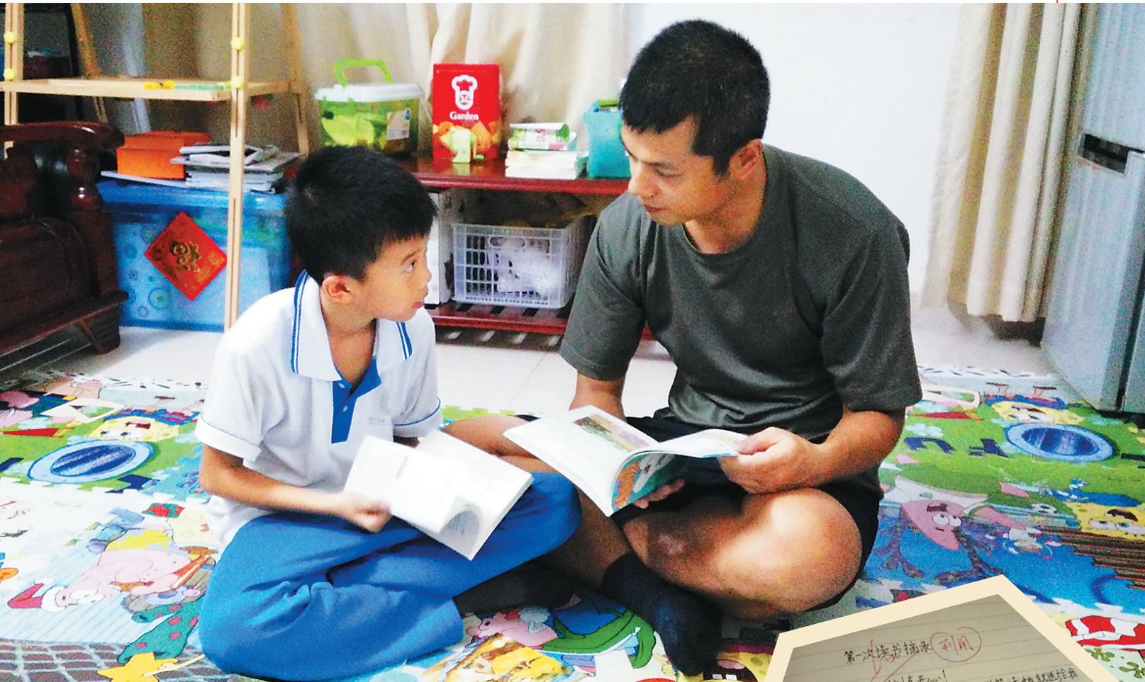
嘉城爸爸陪子读书,陪伴是最好的爱