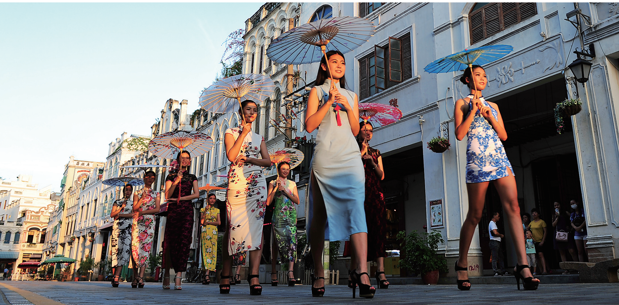
9月26日下午,《中国旗袍》MTV摄制组正在海口骑楼老街取景拍摄。据了解,海口骑楼老街是不少来海口旅游外地人必看的景点之一,目前也成为一些电影电视摄制组的取景地,几乎每周都有摄制组、摄影爱好者到骑楼老街取景拍摄。

保登记和非现金缴费即时同步完成。据人社厅相关工作人员介绍,实行城镇居民医保非现金缴费,将为参保人提供更