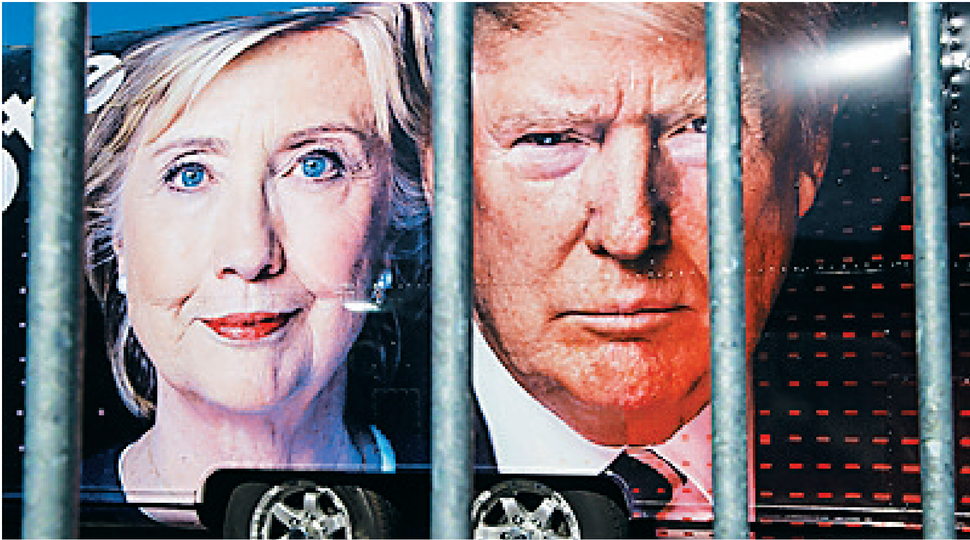
在CNN的转播车上可见希拉里和特朗普的大幅海报。

但凡关注大选的美国人，眼下最期待的节目当属美国东部时间9月26日晚民主党总统候选人希拉里·克林顿和共和党总统候选人唐纳德·特朗普之间首场电视辩论。一位拿“说话”当本行，一位以“大嘴王”著称，究竟谁的唇枪舌剑能戳破对手、戳中人心？真不好说。