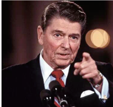
里根在电视辩论中发言。

56年前，也是9月26日，美国大选开始玩新花样，两党总统候选人辩论首次走上荧屏。没想到，第一次玩，就直接影响大选。更没想到，赢的关键是“卖相”。