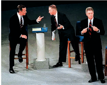
克林顿(右)在电视辩论中发言。