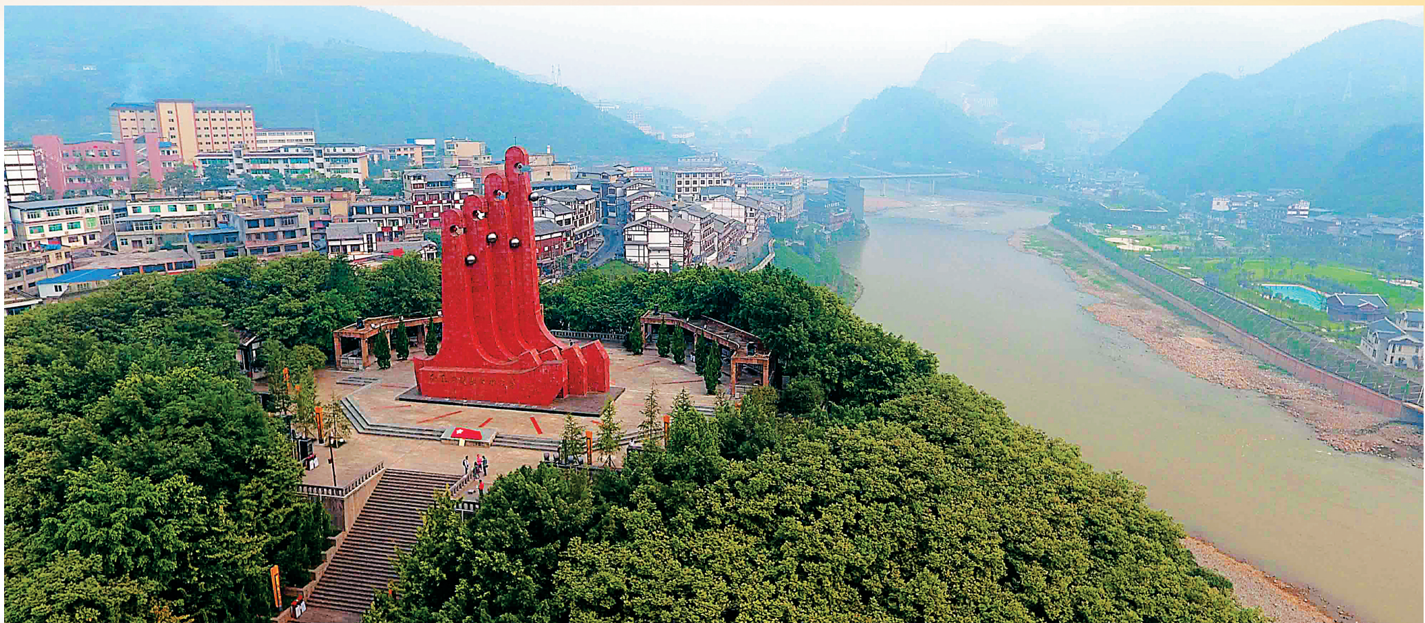
贵州茅台镇红军四渡赤水纪念碑。