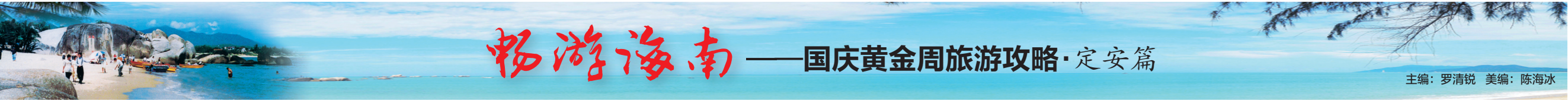
主编：罗清锐 美编：陈海冰

说到底，影迷就是影迷，专家就是专家，这两类人做评委，侧重点肯定各不相同。上海电影节评委肯定是专家型评委，他们评选的影帝影后在表演水平上当然是参赛片中最高的；而百花奖的评选就是影迷水平，他们只能把自己心目中的偶像评选出来，根本没有能力顾及演员的表演水平，因此谁红谁就更占便宜。