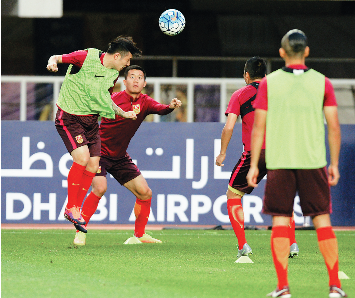
10月4日，中国国家男足在陕西省体育场训练，备战6日举行的世界杯预选赛亚洲区12强赛对阵叙利亚队的比赛。

世界杯扩军至48队的想法自然会带来一些新问题，比如16支直接进入小组赛的种子队如何决定，是按照其最新的国际足联排名还是按照其他标准，而承办更大规模的世界杯无疑对东道主在提供赛场、训练场、酒店、交通等基础设施的能力上也提出了更高的要求。