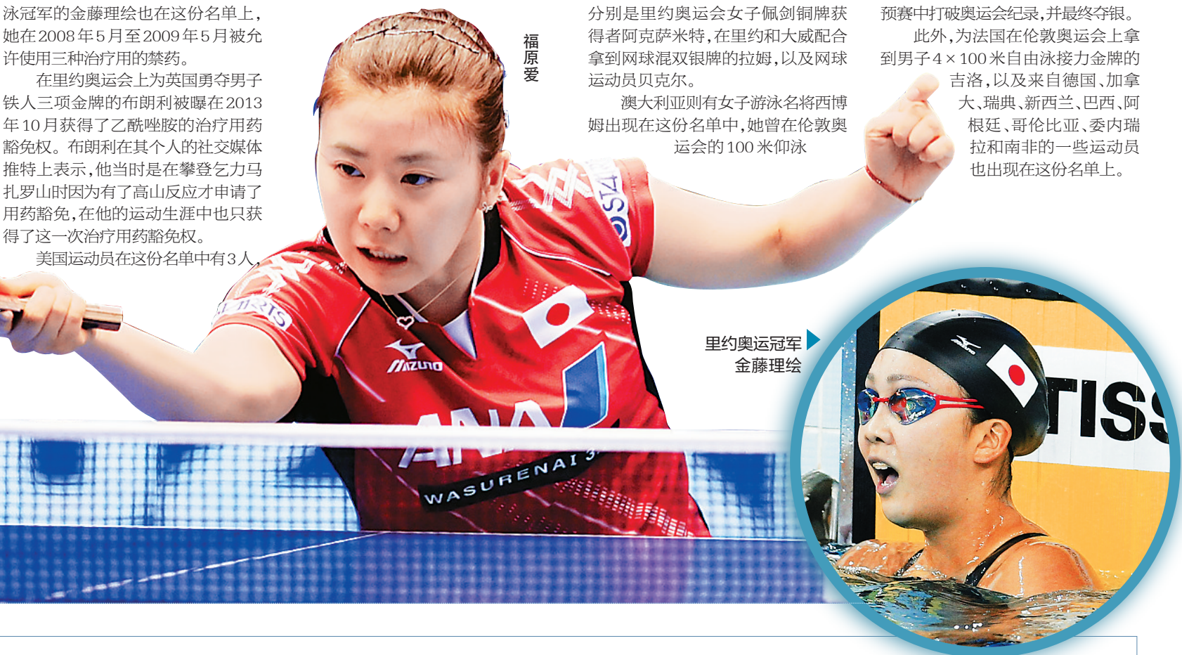
里约奥运冠军金藤理绘

此外，为法国在伦敦奥运会上拿到男子4×100米自由泳接力金牌的吉洛，以及来自德国、加拿大、瑞典、新西兰、巴西、阿根廷、哥伦比亚、委内瑞拉和南非的一些运动员也出现在这份名单上。