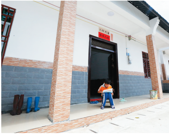
农民住上了“安心房”。