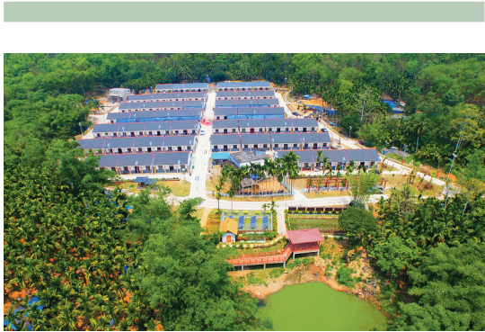
琼中通过创新的金融扶贫模式对农村危房进行改造。

湾岭镇里塞村村民王昌发是建档立卡贫困户，今年4月，他“乘坐”琼中危房改造这列“幸福快车”，自己出了9500元，政府补贴6万元，盖了一间600平方米的平顶房，他的房子现在正在进行装修，预计10月底王昌发、王琼兰夫妇就可以住上新房了。