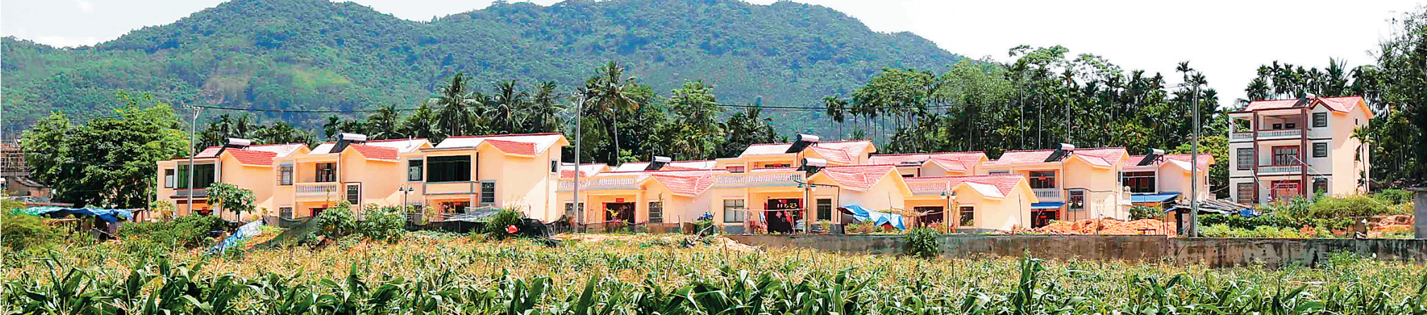
和平镇埡对村是琼中农村危房改造的成功试点之一。

琼中黎族苗族自治县家家户户都在盖新房，那么，农民盖房子的钱从何而来呢？一是政府的农村危房改造补助；二是政府贴息 的农房抵押贷款。 2014年12月，琼中湾岭镇大边村试点农房抵押贷款，新建110平方米的住房可以抵押贷款7.5万元，90平方米的住房可以抵押贷款4.8万元。一栋造价15万元的110平方米新楼，除了贷款、危房改造的补贴，村民自己只要掏出两三万元，就能住进新房。大边村是琼中农村危房改造的一个缩影。 如今，走在湾岭镇丰里村、水央村等贫困村寨，也都能看到农民住上“安心房”，这主要得益于琼中县在农村危房改造工作中实施的提高补助标准、创新金融模式这“两大法宝”。