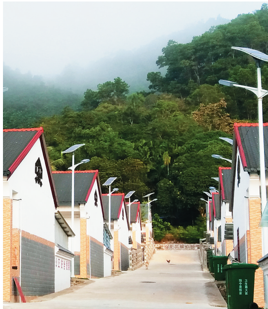
湾岭镇大边村新貌。

在创新金融模式上，琼中进一步巩固推广小额贷款琼中模式，在实行“林权”抵押贷款基础上，2014年6月率先在全省开展农民住房财产权抵押贷款试点工作，探索建立农民住房财产权“大边村”模式，即政府帮助农民办理房产证，通过抵押给银行，给农户