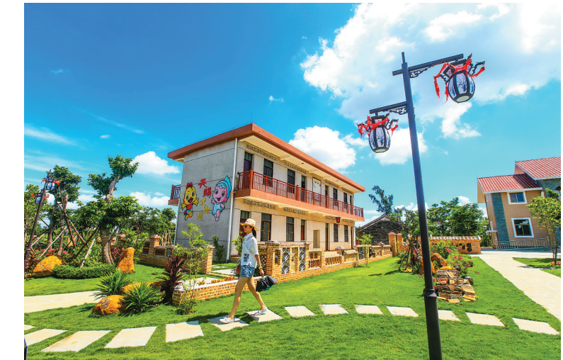
文昌潭牛镇天赐村也建起了民宿。

在琼海大路镇文头坡村田园梦想农庄,黄绿相间的田洋、错落有致的小木屋跃然眼前,让人十分舒适。游客可以在这里体验采摘乐趣、品尝农家饭,下一步,这里将会打造一个名为“村里的月光”树屋建筑式民宿。 电影里,我们时常看到环球创意