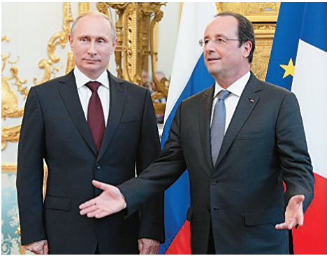
普京曾经与奥朗德会晤的资料图片。

奥朗德当天在法国东北部城市斯特拉斯堡出席欧洲委员会会议。 奥朗德说,法国和俄罗斯就叙利亚问题存在重大分歧,俄罗斯否决了法国就叙利亚问题起草的决议草案。 就叙利亚问题,法国认为仍有磋商必要。“如果我们能推进和平、结束轰炸并宣布停火,我已经做好准备与普京总统会晤,”奥朗德说。 此前,奥朗德接受媒体采访时表示,不能确定是否在巴黎会见普京。奥朗德说,叙利亚政府得到俄罗斯支持,在阿勒颇犯下“战争罪”,这里的居民成为战争罪受害者。那些罪犯应被绳之以法,包括在国际刑事法院受审。 陈立希(新华社专特稿)