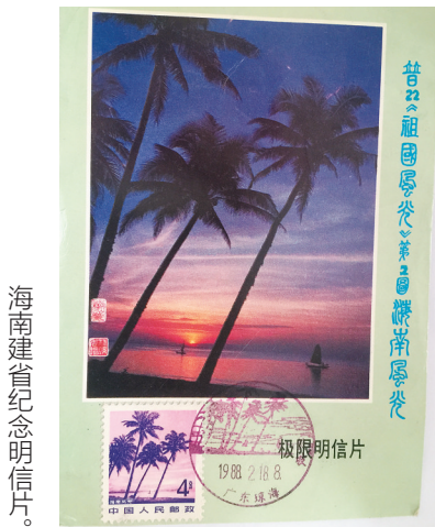
海南建省纪念明信片。