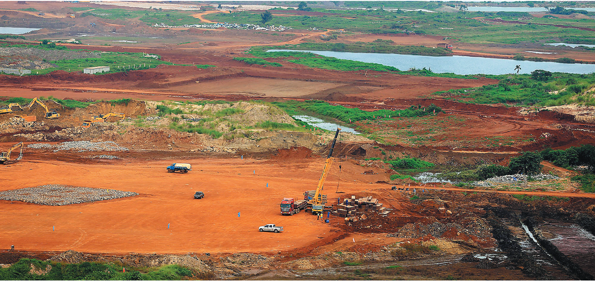
海口美兰机场二期扩建项目加紧建设

海南医疗队的到来不仅感动了磅湛，在金边甚至整个在柬埔寨都产生了极为深远的影响。柬埔寨国家电视台是该国唯一的公共电视台，在黄金时段对此次“光明行”做了长达11分钟的报道。柬埔寨主流柬文报纸《柬埔寨之光》持续聚焦“光明行”，并用整版报道启动仪式。当地华文媒体《柬