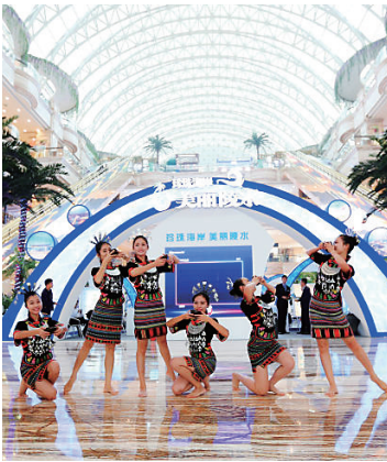
陵水精心准备的黎族歌舞表演，成为推介活动中的一大亮点。

此次赴成都推介，陵水组织了包括雅居乐——清水湾项目、绿城蓝湾小镇、海航陵水YOHO湾以及清水湾旅业——阿罗哈等在内的20个精品楼盘项目参展，并为成都市民精心准备了相关优惠政策。