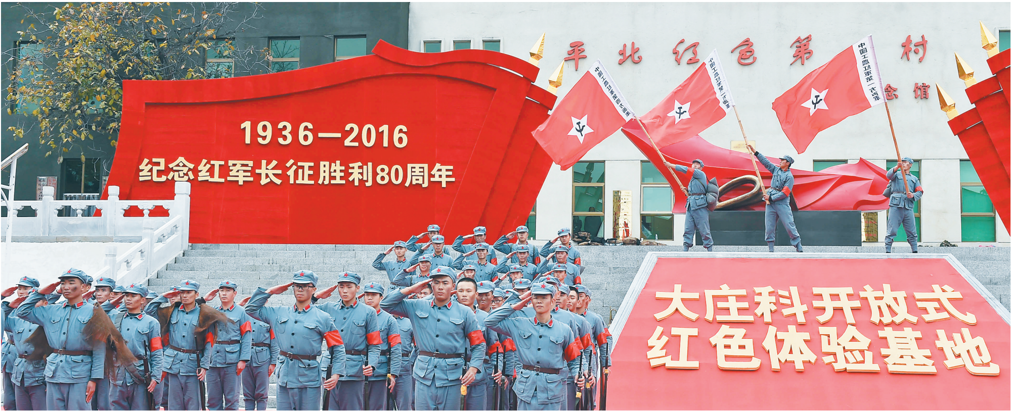
10月22日，演员在北京延庆大庄科开放式红色体验基地进行长征主题实景歌舞表演。