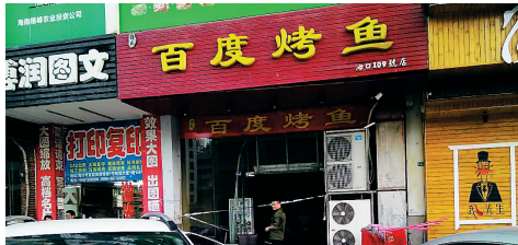
涉事烤鱼店已停止营业。

今天下午6时左右，记者来到该店，看到该店门口已贴上了消防专用封条。烤鱼店和旁边的鹅公馆都未营业。