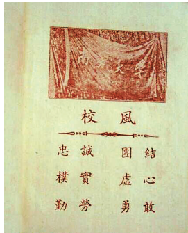
资料记载的南方大学的校风。