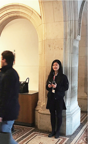
作者在英国国家肖像艺术馆值班。

我今年十六岁,来英国已经两年半了,现在伦敦念高中(英国称A-Level)。与我的中国朋友们不同的是,我除了读书之外,已经做过许多份工作。