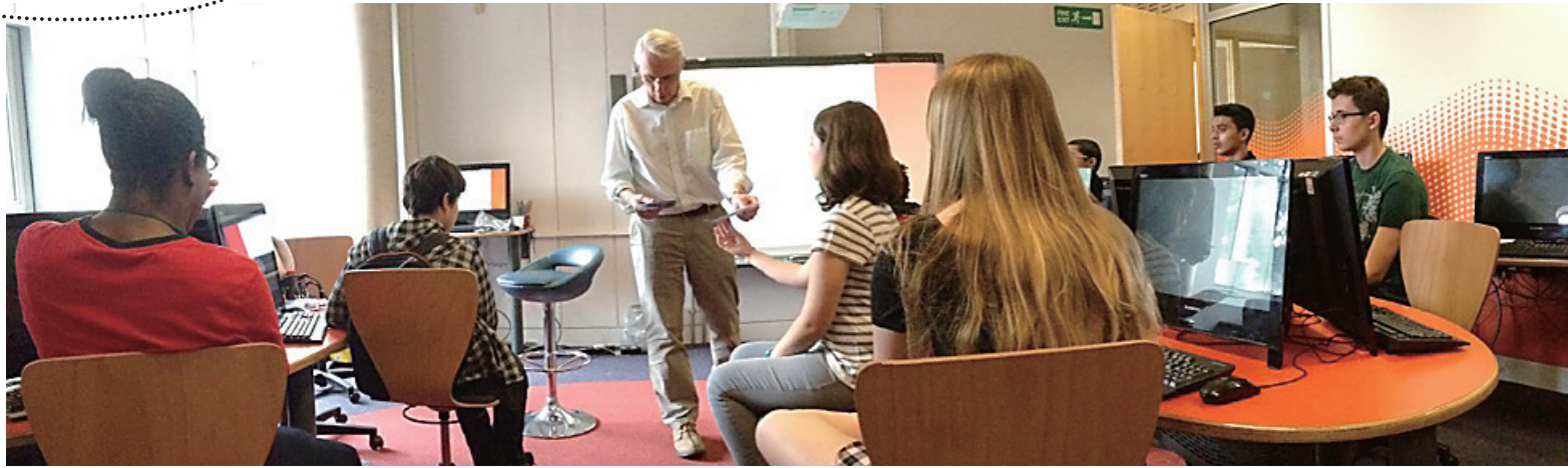
卡姆顿夏校上课场景。