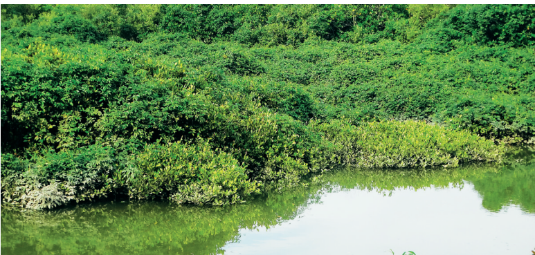
儋州新英湾鱼藤覆盖红树林现象严重,深绿色为鱼藤叶子。

疯长原因之前,先对鱼藤进行人工清除。同时,他呼吁相关部门要及时对全省受鱼藤危害红树林的现状进行全面调查,对尚未遭受危害的区域,应加强防范措施,避免危害面积的扩大;关注鱼藤危害,建立有效的监控管理范畴,制定科学合理、切实可行的防治方法等来遏制其危害。 杨小波介绍说,并非只有外来入侵植物才会成为“植物杀手”,“土著”植物也会成为有害植物。在全球气候变化和人类活动作用等多种原因影响下,植被发生演变,会促使“土著”敏感植物狂长,使之与外来入侵植物一样发生灾变,如前些年海南本土植物金钟藤的大量生长,侵蚀了大面积的次生林或灌丛植被,对森林生态系统及生物多样性造成了严重危害。