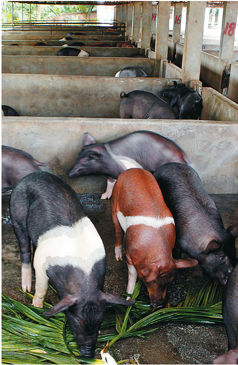
儋州大力扶持企业及农户发展原土黑猪养殖。图为儋州市兰洋镇隆锦良种猪场正在进食的黑猪。

好产品就要卖出好价格。为充分发挥品牌效应，儋州鑫腾生态养殖公司在那大镇开设多家专卖店，自己销售猪肉产品。儋州鑫腾生态养殖公司负责人李桂生说，早露温泉黑猪虽然价格比普通猪肉每斤贵3元左右，但还是供不应求，每天不到9点专卖店的鲜猪肉就被排队等候的市民抢购一空。