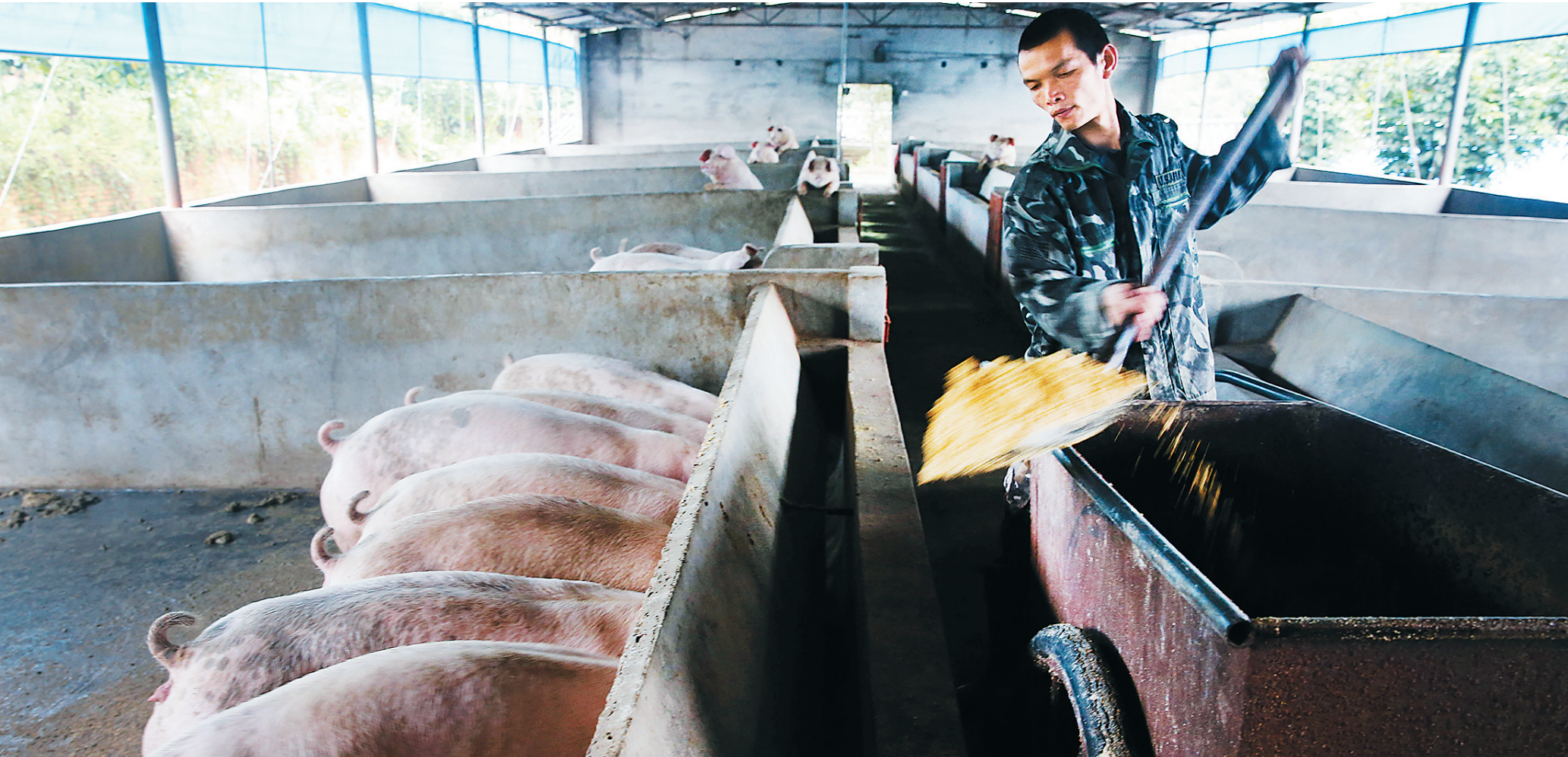
儋州生猪调出连续10年获国务院奖励。图为一名工人正在儋州侨先养猪场喂猪。