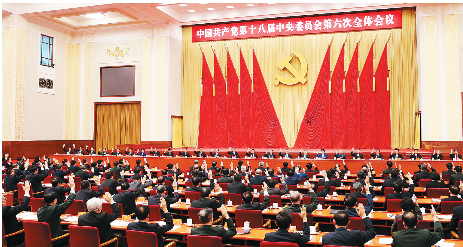
中国共产党第十八届中央委员会第六次全体会议,于2016年10月24日至27日在北京举行。中央政治局主持会议。新华社记者 庞兴雷 摄