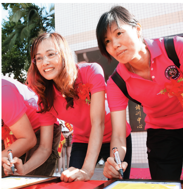
10月29日,韦海英(右二)在韦海英足球培训中心揭牌仪式上。

今年45岁的前女足国脚、海南屯昌人韦海英近日在海口举办海口足球论坛和海南中学韦海英足球培训中心的挂牌成立仪式。这名从海南走出的国脚表示,要打造海南女足的铿锵玫瑰。