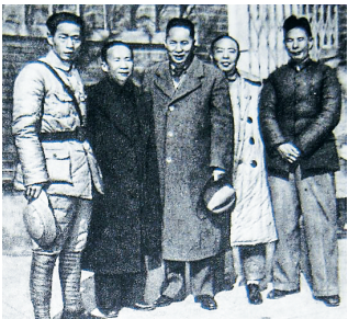
周子昆、张云逸、叶挺、项英、曾山在武汉。