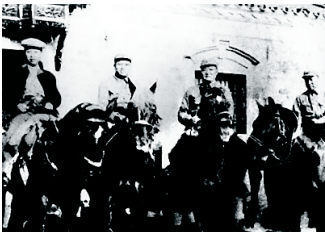
1939年，张云逸（右一）与叶挺（左一）在新四军第4支队第9团驻地。