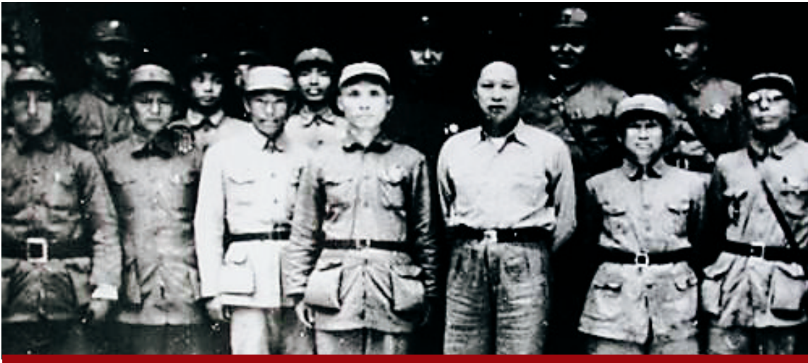
1939年，张云逸（前排右二）与叶挺、邓子恢、罗炳辉等在一起。