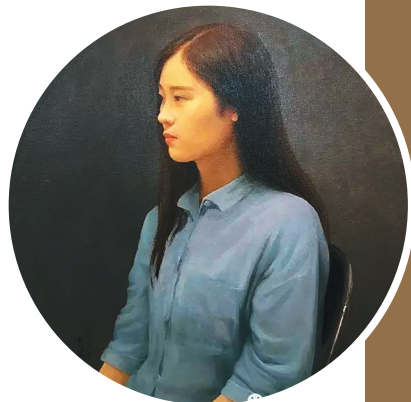
《小马肖像》(油画) 贾斌