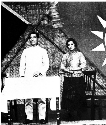
1924年6月16日，孙中山和夫人宋庆龄在黄埔军校开学典礼上。