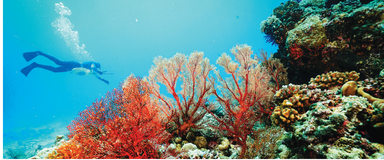
七连屿海域美景。