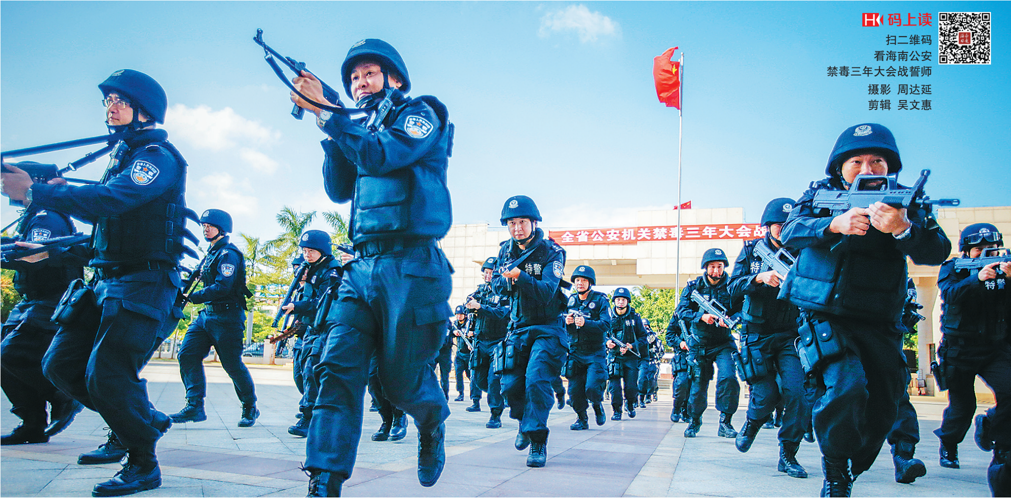
11月8日下午，海南省公安厅举行声势浩大的禁毒三年大会战誓师部署大会。图为全副武装荷枪实弹的特警模拟抓捕毒贩。

第一阶段（2016年11月至2017年4月）工作目标：打击整治工作取得显著战果。在三年时间内，巩固和保持我省打击起诉毒品犯罪效能全国第一的地位。第二阶段（2017年5月至2019年底）工作目标：我省在册吸毒人员人口占比显著降低。新建、扩建海口等13个市县强制隔离戒毒场所，市县收戒床位增加到8642张。